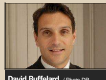
David Buffelard / Photo DR