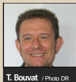
T. Bouvat / Photo DR